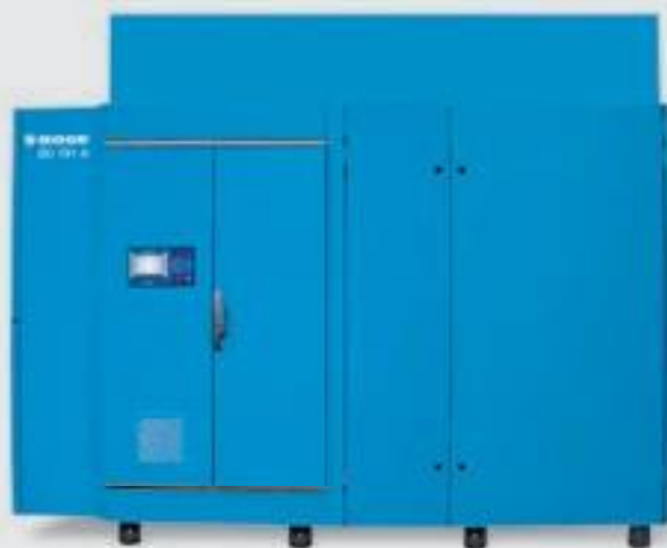
SO 181 A